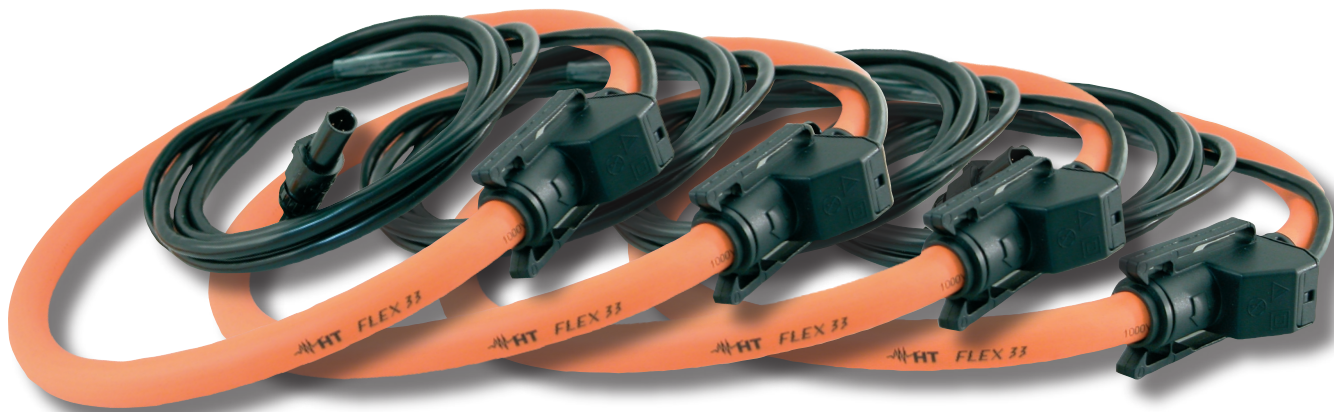
Elastyczne przystawki prądowe HTFLEX33 300A/3000A (na wyposażeniu zestaw 4 sztuk)

Możliwość rozpinania, duża średnica wewnętrzna oraz elastyczność zapewniają niezwykle komfort i uniwersalność zastosowań.